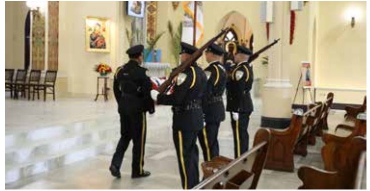
Oficiales de policía de Cicero presentan armas antes del inicio del Blue Mass.

El Reverendo Thomas Dade celebró la primera Misa Azul en 1934 para los funcionarios católicos de policía y bomberos en Washington, D.C., y el evento se extendió rápidamente para convertirse en un servicio nacional celebrado durante la Semana Nacional de la Policía. El servicio recibe su nombre del color del uniforme que los oficiales de policía usan a diario, pero honra a todos los trabajadores de primera línea y profesionales de emergencias médicas.