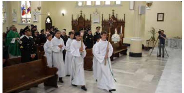
Los monaguillos de Nuestra Señora de Czestochowa traen el crucifijo en procesión al comienzo del servicio.