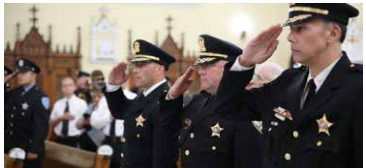
Los oficiales de policía de Cicero saludan la bandera durante el Blue Mass.