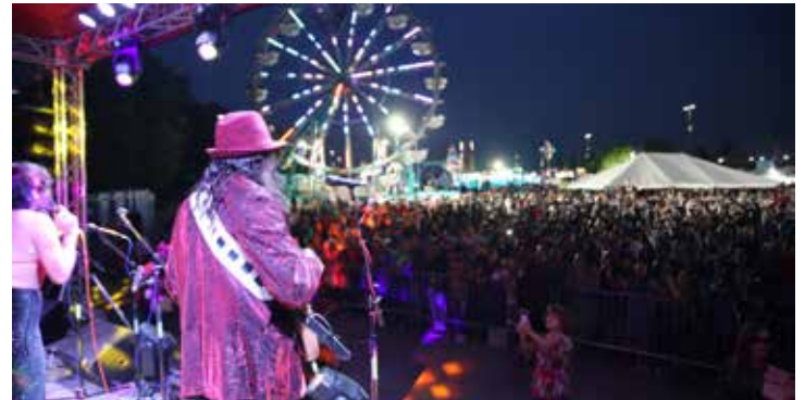
La música en vivo llenó el festival cada noche mientras miles de residentes salían a celebrar.