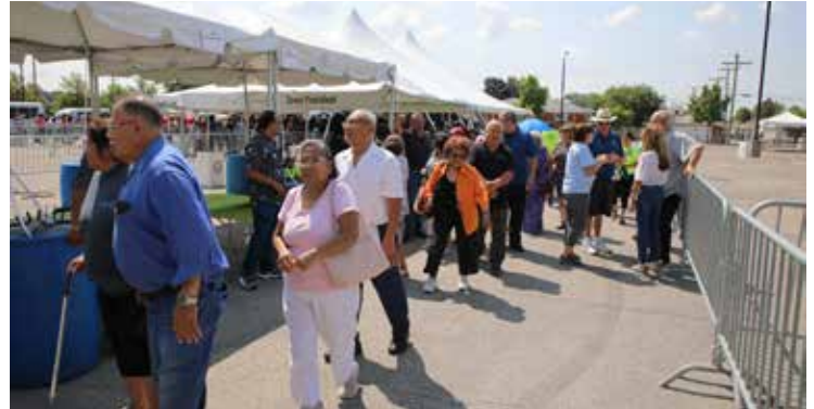
Los residentes ingresan al evento de Cicero y la Cruz Roja para recibir asistencia por los daños causados por la inundación que siguió a la tormenta de julio.