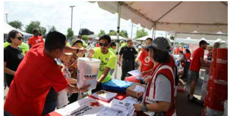
Los voluntarios entregan suministros para ayudar a despejar y limpiar las áreas dañadas por las inundaciones en el evento de recuperación de inundaciones.