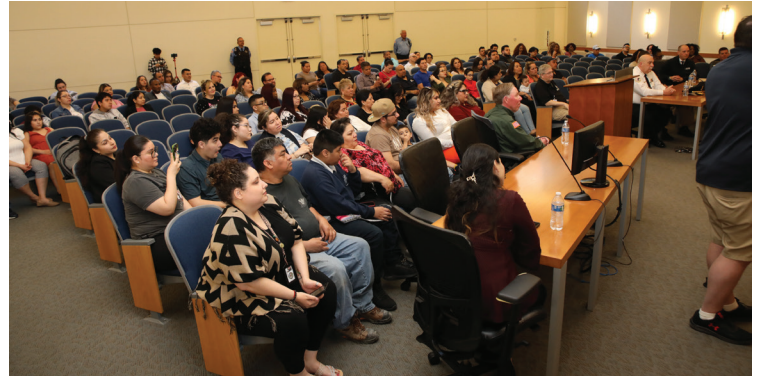
Los voluntarios del CERT esperan sus certificados de finalización como grupo inaugural de voluntarios para completar el programa.