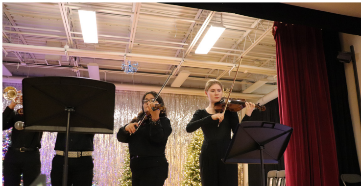
Músicos de Morton High School 201 se unieron a la diversión.