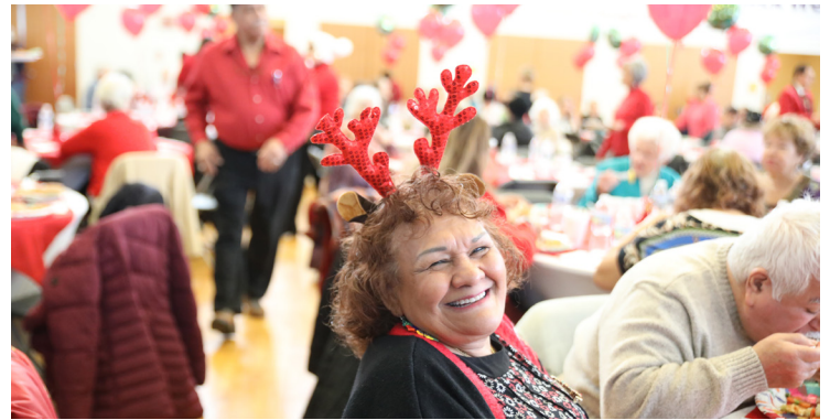
Todo fue sonrisas y diversión en el Centro Comunitario Cicero.