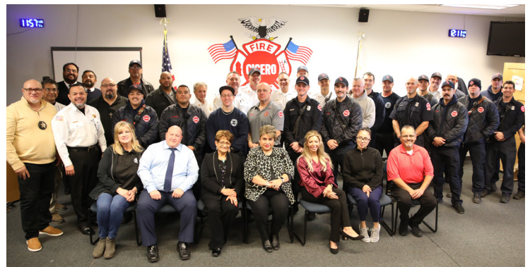
The Fire Department joins town officials after enjoying the holiday gathering.

especialmente durante turnos prolongados y la temporada navideña, destacando la importancia del reconocimiento por parte del comité de sus sacrificios tanto para los bomberos como para los agentes de policía.