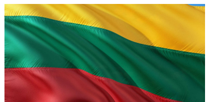
Día de la Independencia de Lituania