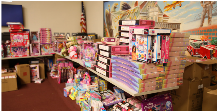
Los regalos se desbordan para que las familias llenen sus canastas navideñas.

Los regalos incluyeron juguetes para los niños de familias necesitadas y canastas de alimentos y regalos para cada familia registrada en la Ciudad de Cicero.