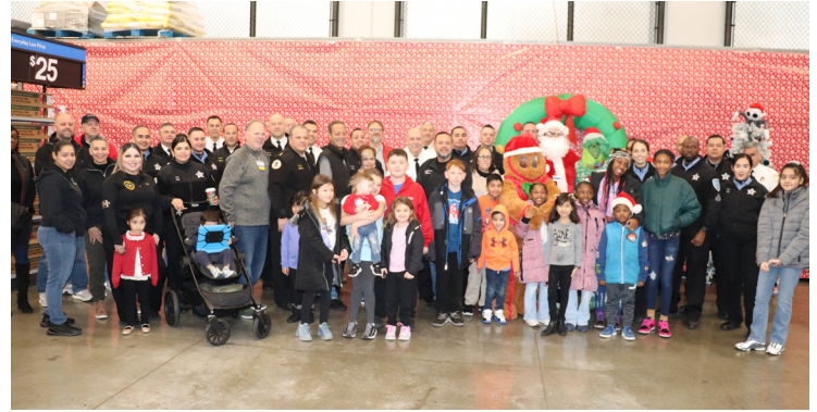
A los oficiales de policía de Cicero se unen las familias que participaron en el evento "Compra con un policía" de este año en Walmart.