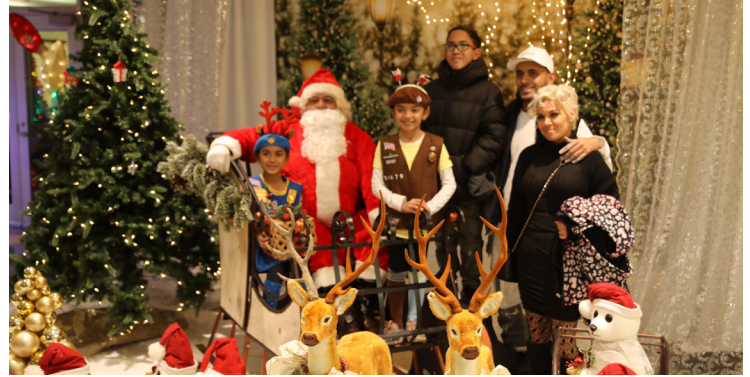
Las familias posaron con Santa en La Posada el 16 de Diciembre.

Es una celebración popular en muchas naciones latinoamericanas, incluidos México, Honduras y Guatemala, que ha ganado popularidad entre muchas comunidades en los Estados Unidos. Como parte de la tradición de Cicero, la gente disfruta de delicias como pan dulce y los niños se llevan a casa un regalo de Navidad anticipado, cortesía del pueblo y del comité.