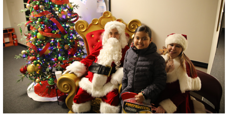
Las familias podrán visitar a Papá Noel durante el evento de la Canasta de Regalos de Navidad el 16 de Diciembre.