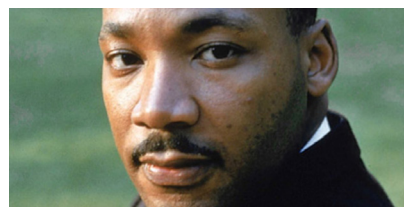
Día de Martin Luther King Cultura Afroamericana