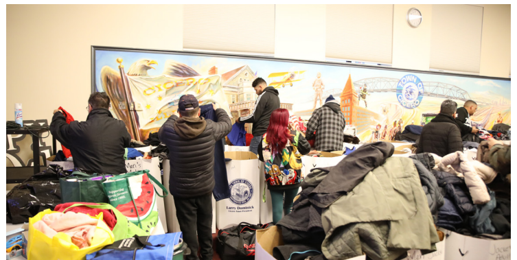
Las familias pasan buscando ropa que les quede bien y otras provisiones que necesitan después del incendio del 1 de diciembre.