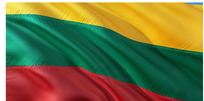
Lithuanian Independence Day