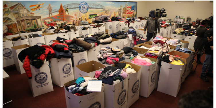
Las cajas estaban repletas de donaciones de los residentes para cubrir las necesidades básicas de las víctimas del incendio del 1 de diciembre.