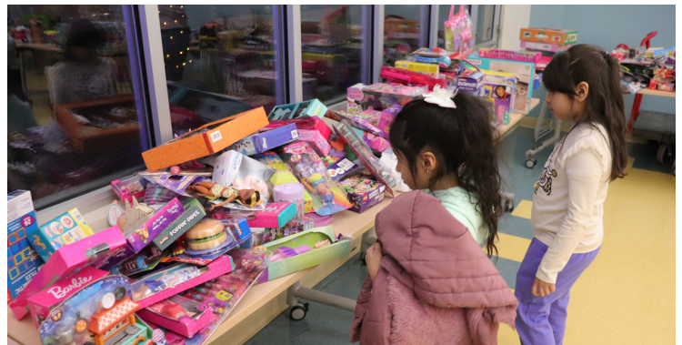
Los niños examinan detenidamente los numerosos juguetes disponibles para llevarse a casa como parte de la celebración.